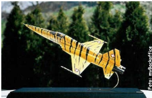
Es ist vollbracht!

Erstaunlicherweise war es gar nicht so einfach, Vitrine und Sockel für das 47 cm lange Modell zu beschaffen, da sich manche Lieferanten höchst uninteressiert zeigten: Anfragen wurden nicht beantwortet, bestellte Kataloge nicht geliefert. Ob die wohl ein leistungsfähiges Backoffice brauchen könnten...?